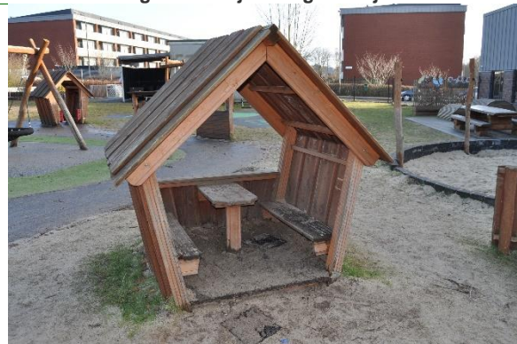
Redskab: Legehus Producent: Rudeco Er redskabet mærket: Ja Emne 4: Er der registreret fejl / mangler: Ja