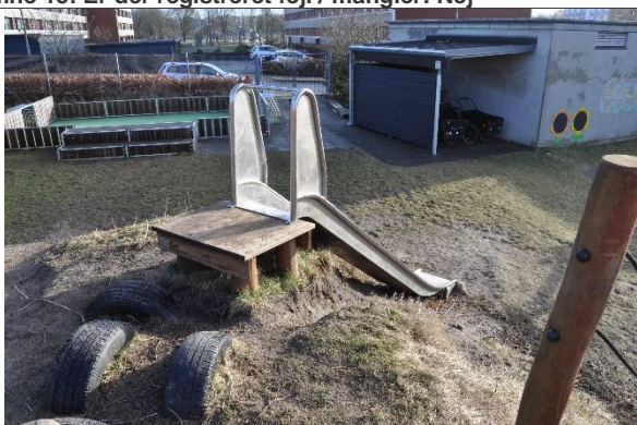
Redskab: Rutsjebane Producent: Rudeco Er redskabet mærket: Ja Emne 17: Er der registreret fejl / mangler: Nej