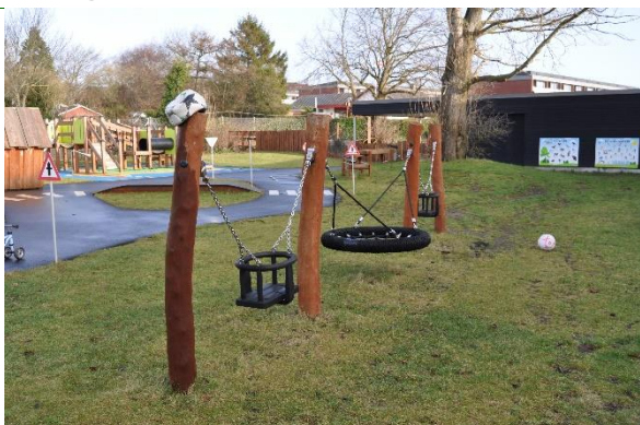
Redskab: Gynger Producent: Rudeco Er redskabet mærket: Ja Emne 43: Er der registreret fejl / mangler: Nej