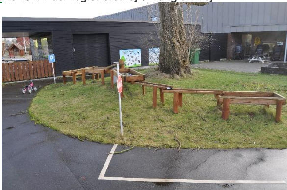
Redskab: Vandleg Producent: Rudeco Er redskabet mærket: Ja Emne 33: Er der registreret fejl / mangler: Nej