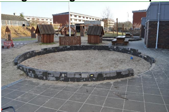
Redskab: Sandkasse Producent: JRJ Ribe Er redskabet mærket: Ja Emne 1: Er der registreret fejl / mangler: Nej