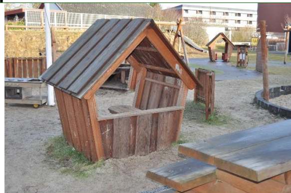
Redskab: Legehus Producent: Rudeco Er redskabet mærket: Ja Emne 2: Er der registreret fejl / mangler: Nej