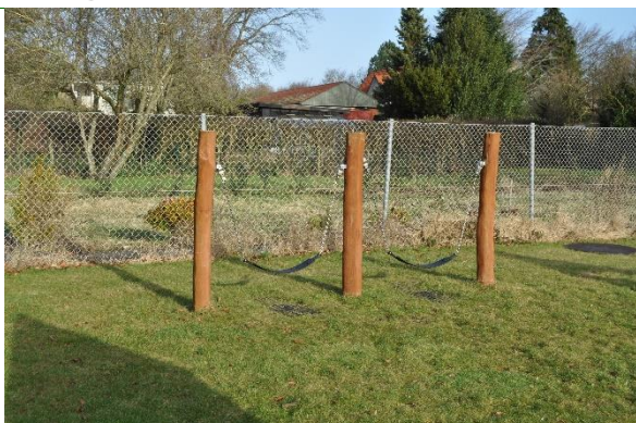
Redskab: Hængekøje Årgang: 2021 Producent: Rudeco Er redskabet mærket: Ja Emne 31: Er der registreret fejl / mangler: Nej