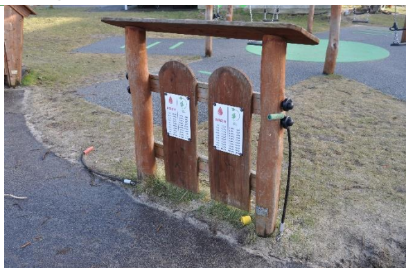
Redskab: Legeredskab Producent: Rudeco Er redskabet mærket: Ja Emne 7: Er der registreret fejl / mangler: Nej