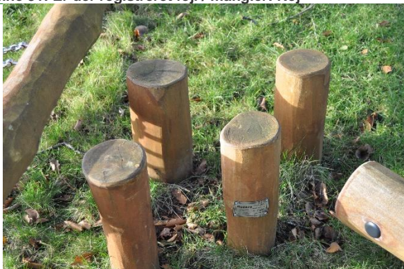
Redskab: Balance stolpe Årgang: 2021 Producent: Rudeco Er redskabet mærket: Ja Emne 33: Er der registreret fejl / mangler: Nej