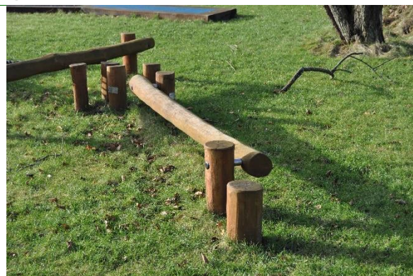
Redskab: Balancebom Årgang: 2021 Producent: Rudeco Er redskabet mærket: Ja Emne 32: Er der registreret fejl / mangler: Nej