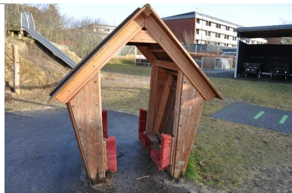
Redskab: Legehus Producent: Rudeco Er redskabet mærket: Ja Emne 8: Er der registreret fejl / mangler: Nej