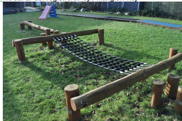
Redskab: Klanternet Årgang: 2021 Producent: Rudeco Er redskabet mærket: Ja Emne 34: Er der registreret fejl / mangler: Nej