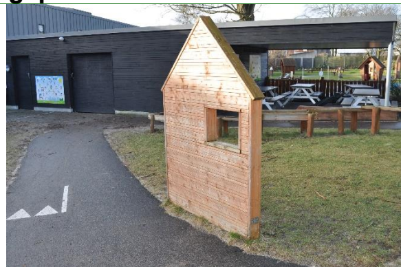
Redskab: Redskab: Legeredskab Årgang: 2021 Producent: Rudeco Er redskabet mærket: Ja Emne 20: Er der registreret fejl / mangler: Nej