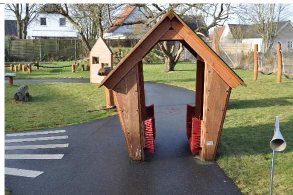
Redskab: Legehus Årgang: 2021 Producent: Rudeco Er redskabet mærket: Ja Emne 26: Er der registreret fejl / mangler: Nej