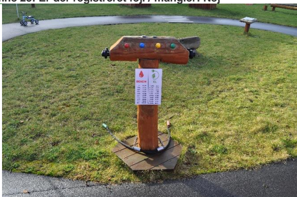
Redskab: Legeredskab Årgang: 2021 Producent: Rudeco Er redskabet mærket: Ja Emne 27: Er der registreret fejl / mangler: Nej