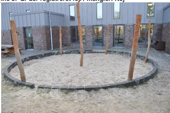
Redskab: Sandkasse Producent: JRJ Ribe Er redskabet mærket: Ja Emne 5: Er der registreret fejl / mangler : Nej