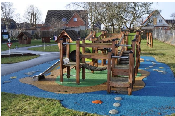
Redskab: Klatrerredskab m. rutsjebane Årgang: 2021 Producent: Rudeco Er redskabet mærket: Ja Emne 25: Er der registreret fejl / mangler: Nej