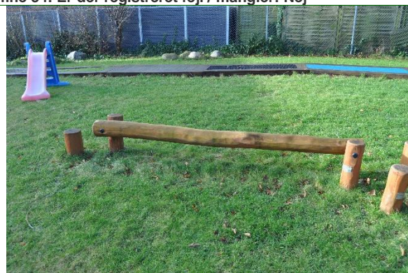
Redskab: Årgang: Producent: Er redskabet mærket: Emne 36: Er der registreret fejl / mangler: Nej