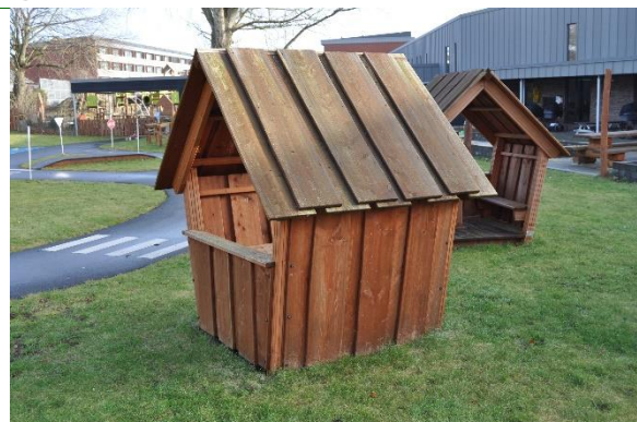
Redskab: Legehus Årgang: 2021 Producent: Rudeco Er redskabet mærket: Ja Emne 38: Er der registreret fejl / mangler: Nej