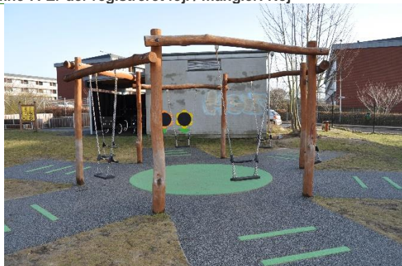
Redskab: Gruppegyng Producent: Rudeco Er redskabet mærket: Ja Emne 9: Er der registreret fejl / mangler: Nej