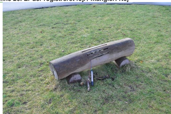
Redskab: Tromme Årgang: 2021 Producent: Rudeco Er redskabet mærket: Ja Emne 28: Er der registreret fejl / mangler: Nej