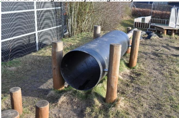
Redskab: Tunnel Producent: Rudeco Er redskabet mærket: 2021 Emne 15: Er der registreret fejl / mangler: Nej