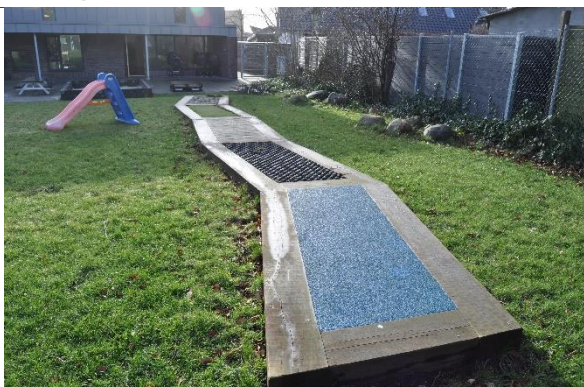
Redskab: Sanse gang Årgang: 2021 Producent: Rudeco Er redskabet mærket: Ja Emne 37: Er der registreret fejl / mangler: Ja