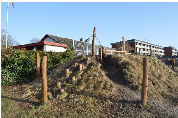
Redskab: Klatreredskab Producent: Rudeco Er redskabet mærket: Ja Emne 13: Er der registreret fejl / mangler: Nej