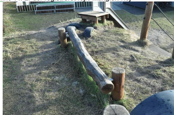
Redskab: Balance redskab Producent: Rudeco Er redskabet mærket: 2021 Emne 16: Er der registreret fejl / mangler: Nej