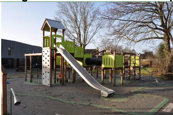
Redskab: Klatreredskab m. rutsjebane Årgang: 2021 Producent: Rudeco Er redskabet mærket: Ja Emne 19: Er der registreret fejl / mangler: Ja