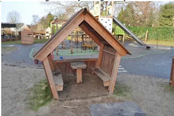
Redskab: Legehus Producent: Rudeco Er redskabet mærket: Ja Emne 3: Er der registreret fejl / mangler: Nej