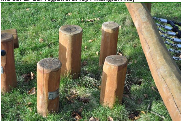
Redskab: Balance stolpe Årgang: 2021 Producent: Rudeco Er redskabet mærket: Ja Emne 35: Er der registreret fejl / mangler: Nej