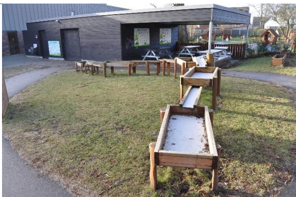
Redskab: Vandlege Årgang: 2021 Producent: Rudeco Er redskabet mærket: Ja Emne 21: Er der registreret fejl / mangler: Nej