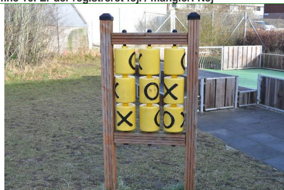
Redskab: Legeredskab Producent: Rudeco Er redskabet mærket: Ja Emne 18: Er der registreret fejl / mangler: Nej