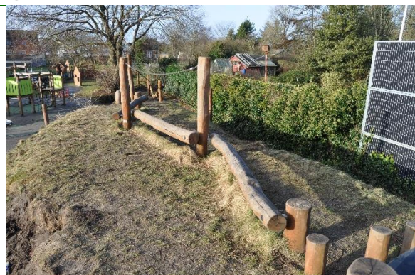
Redskab: Klatreredskab Producent: Rudeco Er redskabet mærket: Ja Emne 14: Er der registreret fejl / mangler: Nej